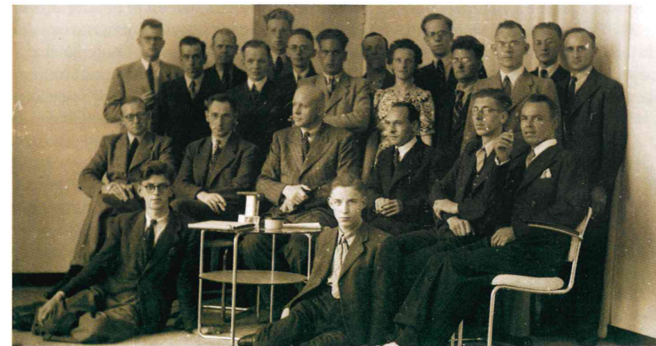
Het personeel van Lopik Radio in 1942.