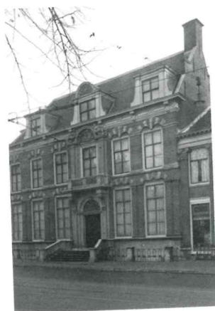
Janskerkhof 12 te Utrecht. (14)