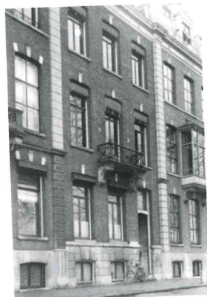
Sarphatikade 11 te Amsterdam. (15)

Al die activiteiten van NOZEMA worden verricht vanuit de kantoren van de nieuwe maatschappij. Eerst gevestigd op een bovenverdieping aan het Janskerkhof 12 te Utrecht, vanaf april 1938 op het adres Sarphatikade 11 in Amsterdam. Rond die tijd telt het zenderbedrijf 27 technische en administratieve werknemers; twaalf in Amsterdam, acht bij de radiocentrale in Delft en zeven in Jaarsveld. Later zal dit aantal werknemers nog toenemen, ondermeer met personeel voor de radiocentrale in en rond Hengelo.