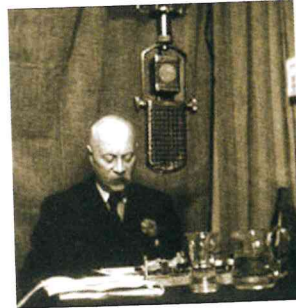
In september 1944 dacht minister-president Gerbrandy dat de oorlog al snel ten einde zou komen. (21)

In het deels bevrijde zuiden van Nederland neemt het Militair Gezag de verzorging van de radio-omroep op zich, zoals u in hoofdstuk 2 "Het omroepwezen in Nederland" kunt lezen. 2 Deze bedient zich van eigen en door Philips gebouwde zenders. Daarmee onttrekken die activiteiten zich aan de beschrijving in dit hoofdstuk. Ook PTT weet tijdens het laatste oorlogsjaar onopgemerkt een tweetal zenders te bouwen. 4